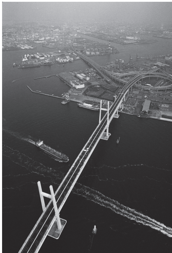
▼横浜ベイブリッジ

本書は、浅田孝の建築・都市を舞台に展開した先駆的試みをまとめたはじめての書籍である。