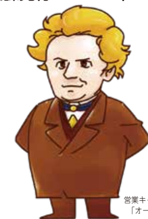
オーム社 営業キャラクター 「オームはかせ」

お時間のあるときにお読みいただき、棚のさらなる活性化にご活用いただけましたら幸いです。